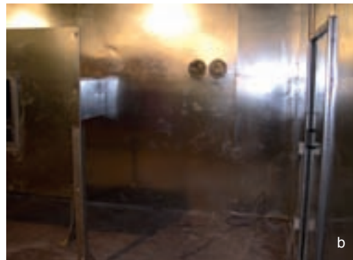
Figg. 2a-2b - Set-up del condotto in condizioni di prova