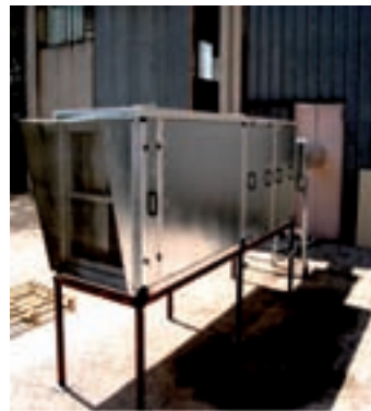
Figura 3 - Particolare della porta d'ingresso